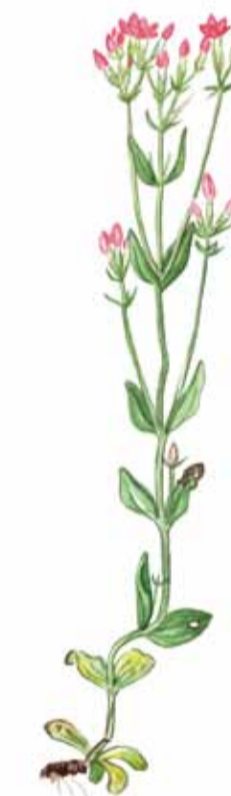
Flockarun Centaurium erythraea Common Centaury Echtes Tausendgüldenkraut Ill. N. Forshed

På de fuktiga markerna invid Julebodaån växer flera arter av orkidéer tillsammans med flockarun och darrgräs.