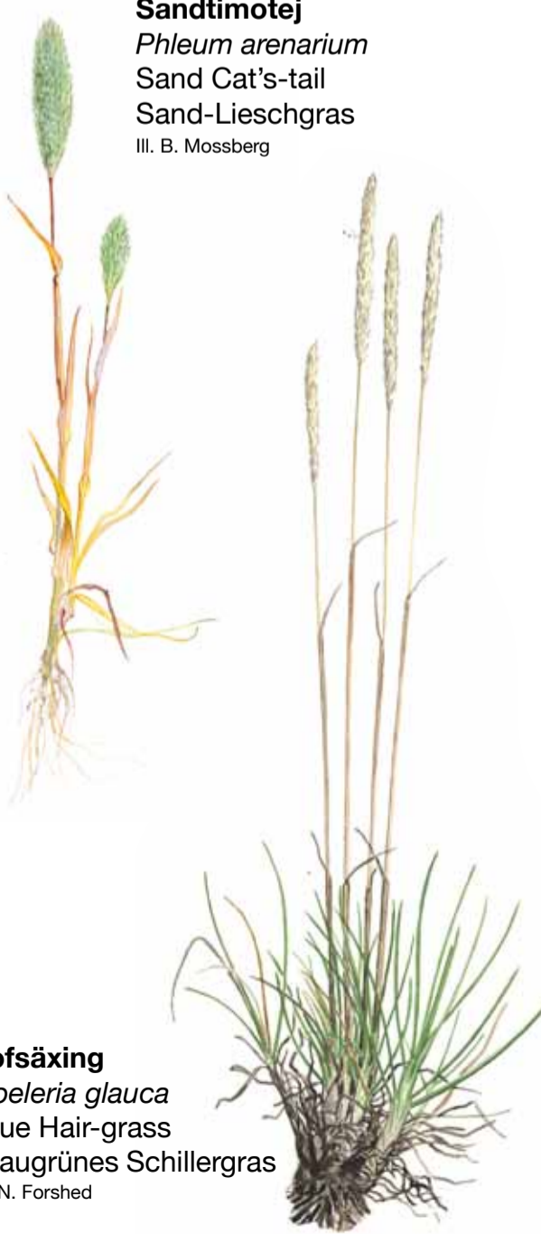
Sandtimotej Phleum arenarium Sand Cat's-tail Sand-Lieschgras Ill. B. Mossberg