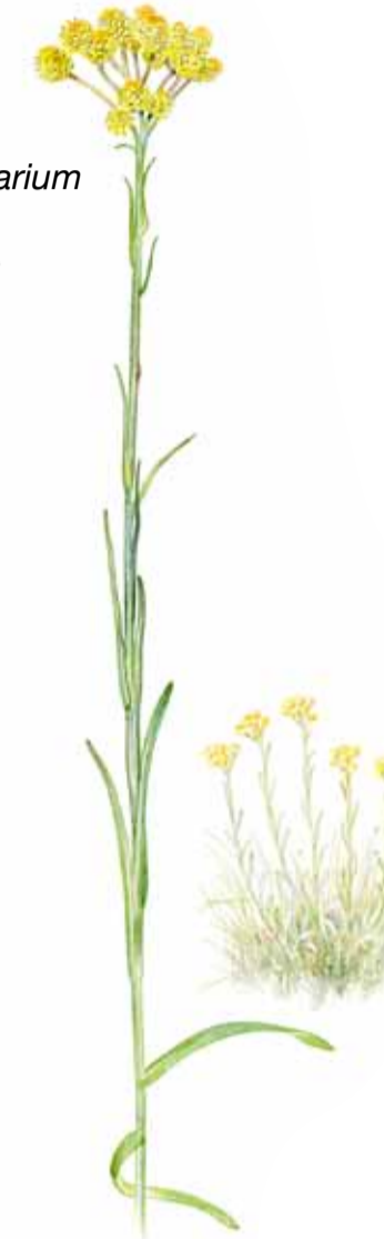
Hedblomster Helichrysum arenarium Dwarf everlast Sand-Strohblume Ill. B. Mossberg