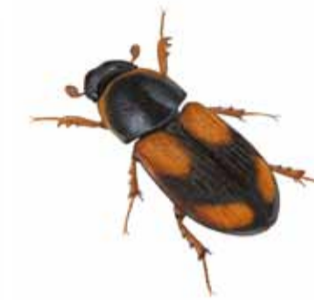
Fyrfälekig dyngbagge Aphodius quadriguttatus Ill. M. Holmer