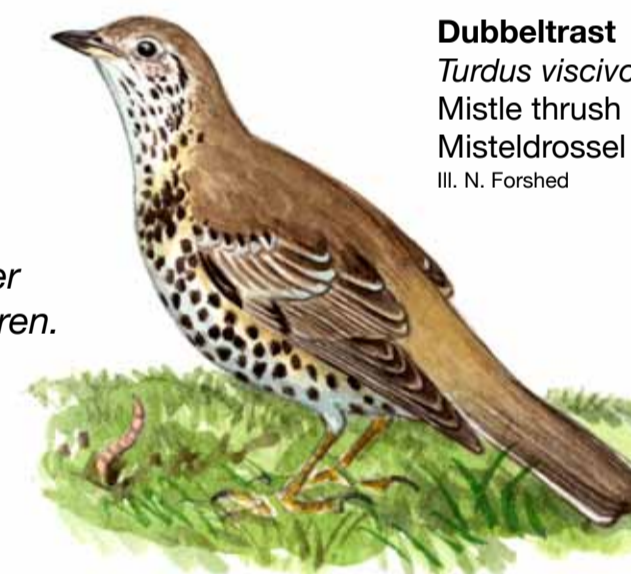
Dubbeltrast Turdus viscivorus Mistle thrush Misteldrossel Ill. N. Forshed

På de fuktiga markerna invid Julebodaån växer flera arter av orkidéer tillsammans med flockarun och darrgräs.