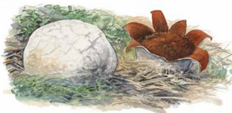
Läderboll Mycenastrum corium Ill. M. Holmer

Trädlärika och dubbeltrast hörs över Kumlan tidigt om våren. Längs ån kan du få syn på kungsfiskare, forsärla och mindre hackspett.