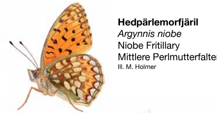
Hedpärlemorfjäril Argynnis niobe Niobe Fritillary Mittlere Perlmutterfalter