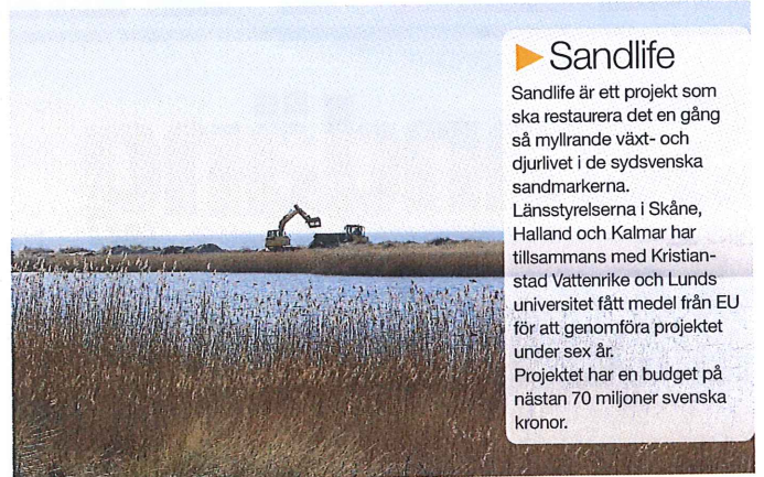
GRÄVSKOPAN är redan ute på Nabben och gräver.

– Vi har gjort samma åtgärd i Ängelholm och där