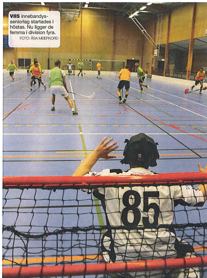
VIIS innebandyseniorlag startades i höstas. Nu ligger de femma i division fyra.