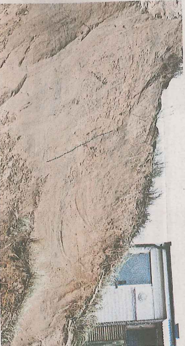
SKARPA KANTER. Sanddynerna har gröpits ur av stormen Egon och gett nya perspektiv längs stranden.