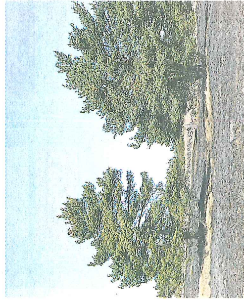
Runt området som bestod av väldigt torrt gräs fanns 1 kilometer vattenslang utlagd.

MARIA BRYNIELSSON maria.brynielsson@olandsbladet.se