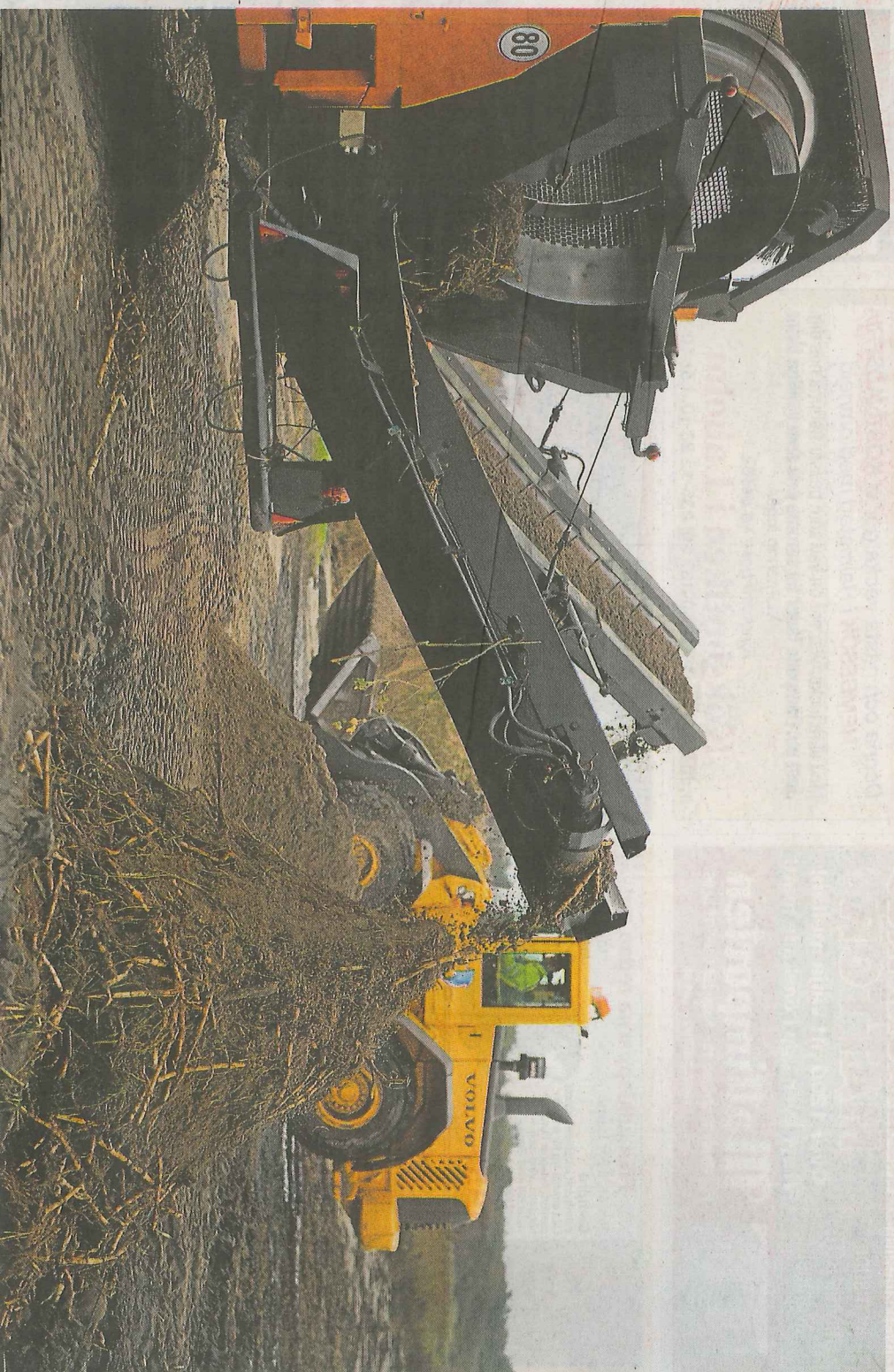
TUGGAR PÅ. Grävskoporna ger sig på buskage av vresros och rugger av vass. Sältningsverket skiljer sedan på växtdelarna och sanden. Det senare läggs tillbaka när arbetet går vidare söderut längs Haverdalsstranden.

Maskin äter sig fram längs strandsträcka på 3,6 kilometer