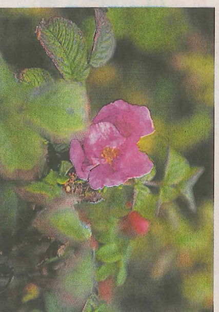
HÄRDIG. Vresrosen togs från Japan till Sverige av Linnés lärjungar Thunberg. Den kom att planteras för att binda sanden längs Kattegattkusterna, både i Sverige och i Danmark.